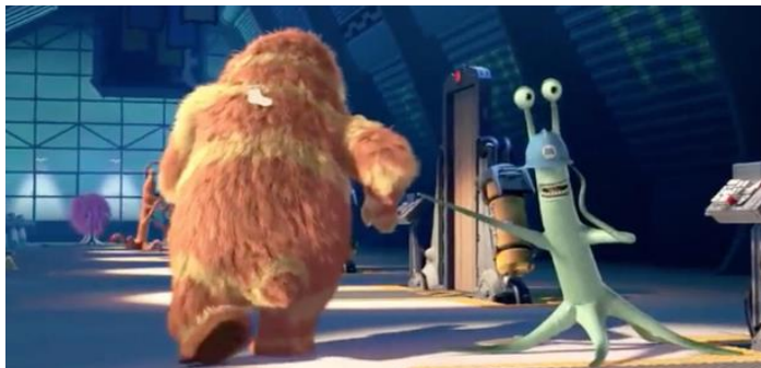
Aneb co se vám v laboratoři stane, když nastane kontaminace. Věřte mi. Fakt. Oholí vás. A ten límec taky dostanete.

Základním problémem, se kterým se mikrobiologové při experimentování denně setkávají, je zajištění dokonalé sterility pracovního prostředí – nepotřebujeme, aby nám na miskách rostlo něco, co tam nepatří. V profesionální laboratoři je jakákoliv kontaminace cizorodými organismy nepřípustná, protože ovlivňuje a tím znehodnocuje pracně získané výsledky; při experimentování je tedy nutné důsledně dodržovat postupy aseptické práce. Se stejným problémem se při řešení této úlohy budete muset poprat i vy, a proto se nyní seznámíme s několika základními pravidly, která vám pomohou k dosažení co nejlepších výsledků.