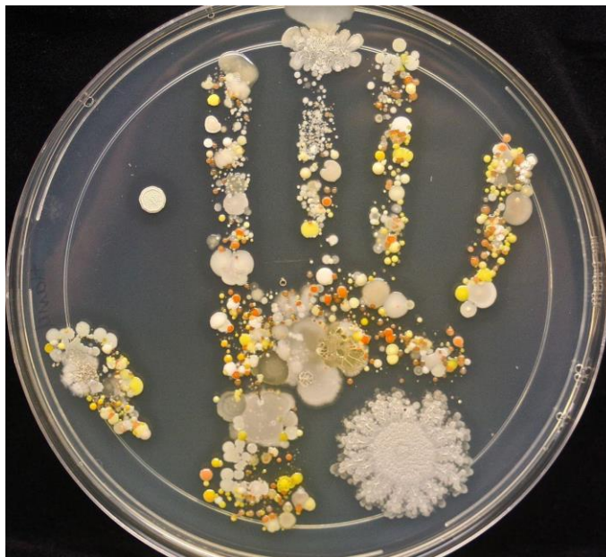
Světznámý otisk ruky na agaru.

Země je planeta života. A přestože život, který vidíme kolem nás, je z velké většiny buďto chlupatý, opeřený, šupinatý, bzučící anebo zelený, drtivou většinu veškerých živých organismů na zemi tvoří život, který nevidíme – mikroorganismy ve formě bakterií, kvasinek, plísní, mikroskopických hub a taky v mnoha dalších podobách – připravovali jste někdy v hodinách biologie třeba senný nálev? Jak vám ale musí být jasné, ne všude je mikroskopický život stejný – v půdě nalezneme jiné bakterie než ve vodě a ve vodě zase jiné než třeba na živočiších nebo rostlinách. My si nyní vytvoříme jakousi mikrobiologickou „mapu“ vaší domácnosti.