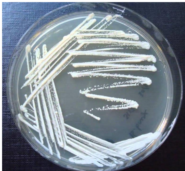
Křížový roztěr bakteriální kultury na agarové plotně.

Agarové plotny, jak už víte, slouží k tomu, abychom mohli pozorovat či stanovovat organismy pouhým okem běžně nepozorovatelné. V praxi se nejčastěji jedná o Petriho misky, do kterých naléváme tenkou vrstvu živného média obsahujícího agar – želírovací agens sloužící k tomu, aby médium ztuhlo a vytvořilo nám tzv. plotnu, která bude sloužit jako substrát pro růst mikroorganismů; jedinou buňku mikroorganismu bez mikroskopu nepostřehneme, jakmile ale utvoří kolonii (soubor jedinců vzniklých z dělení jediné původní buňky), stává se pozorovatelnou. Agarové plotny mohou obsahovat nejrůznější kombinace látek a živin navržené pro všechny možné účely – my například usilujeme o kultivaci širokého spektra běžných a nenáročných bakterií a podle toho si volíme recepturu agarů: jako živiny nám v agaru poslouží masový bujon a sacharóza.